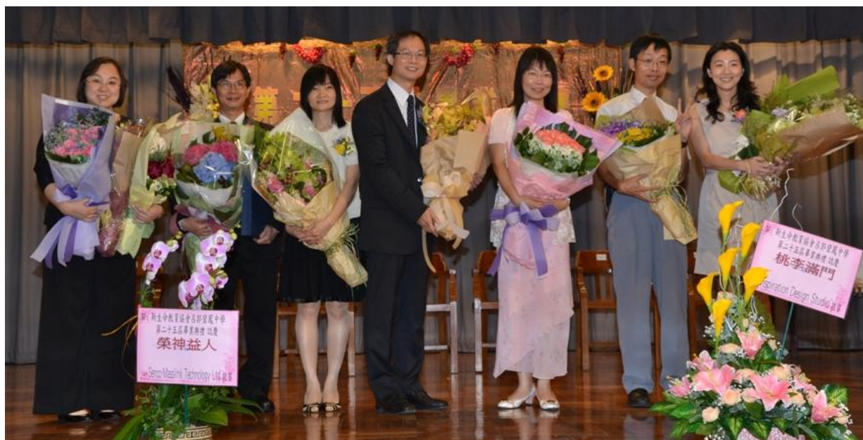
圖為 2010/11 年度畢業禮各學校同工得獎拍照留念